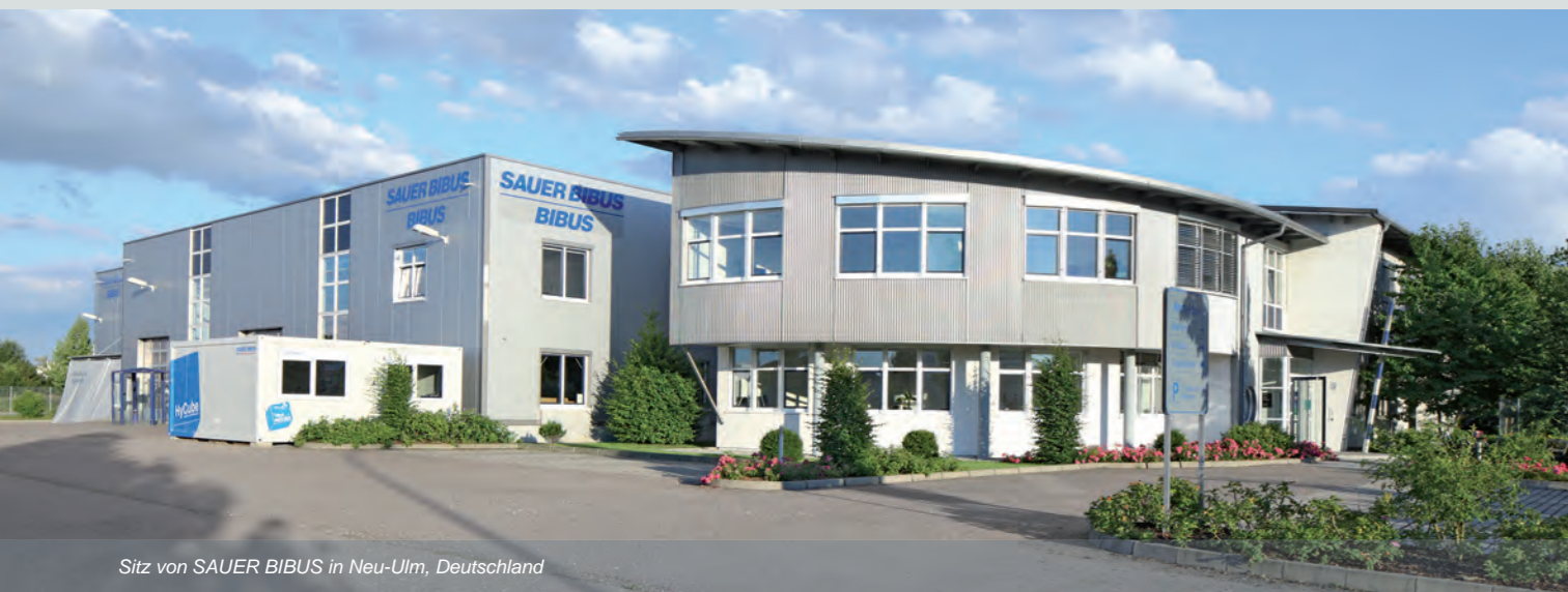
Sitz von SAUER BIBUS in Neu-Ulm, Deutschland