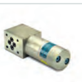
miniBOOSTER HC3 Druckverstärker