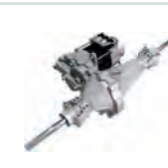
HYDRO-GEAR LT Elektr. Kompakt- achse