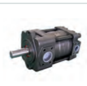
SUMITOMO QQT Innenzahnrad- pumpe