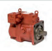
KAWASAKI K3VG Axialkolbenpumpe