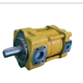
SUMITOMO QT Innenzahnrad- pumpe