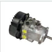
HYDRO-GEAR PG Hydr. Kompakt- pumpe