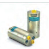
miniBOOSTER HC4 Druckverstärker