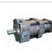
SUMITOMO QTD Innenzahnrad- pumpe