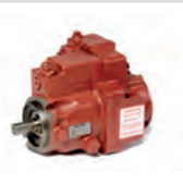
KAWASAKI K3VL Axialkolbenpumpe