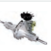
HYDRO-GEAR T2 Hydr. Kompakt- achse