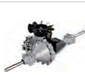
HYDRO-GEAR G730 Hydr. Kompakt- achse